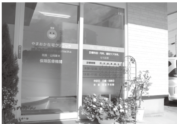
約270人の患者を在宅で支えている

日々の動きとしては、朝から私ともう一人の医師で大分市を広く回り、お昼に一度クリニックに