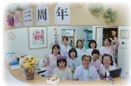
祝3周年をクリニックの仲間と