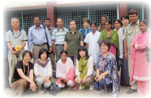
高山看護師も参加（2011年8月）

そして、彼のバイタリティと思いが世界へ広がり、一緒にバンングラデシュ訪問ができる日を楽しみにしています。