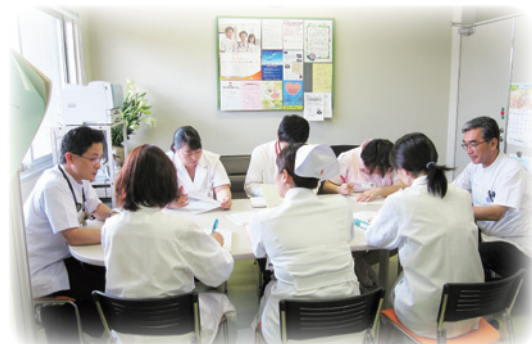
緩和ケアミーティング