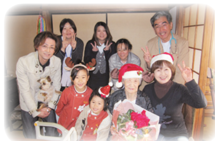
102歳の患者さんの誕生日を祝う