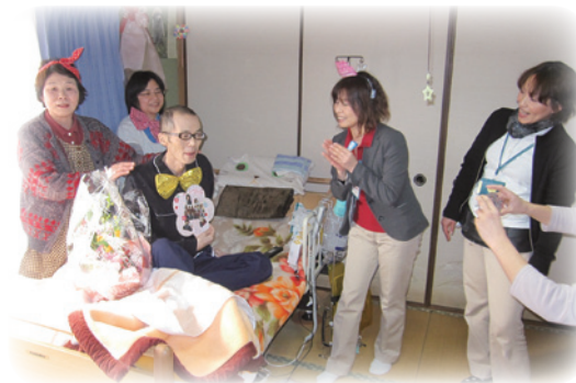
在宅患者さんの誕生日を祝う！

山岡先生、スタッフの皆さんどうぞお体に気をつけて・・・これからも私たちを支えてください！！