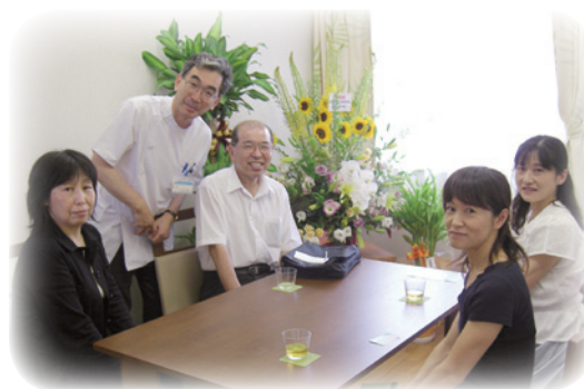
大分・生と死を考える会のメンバーと